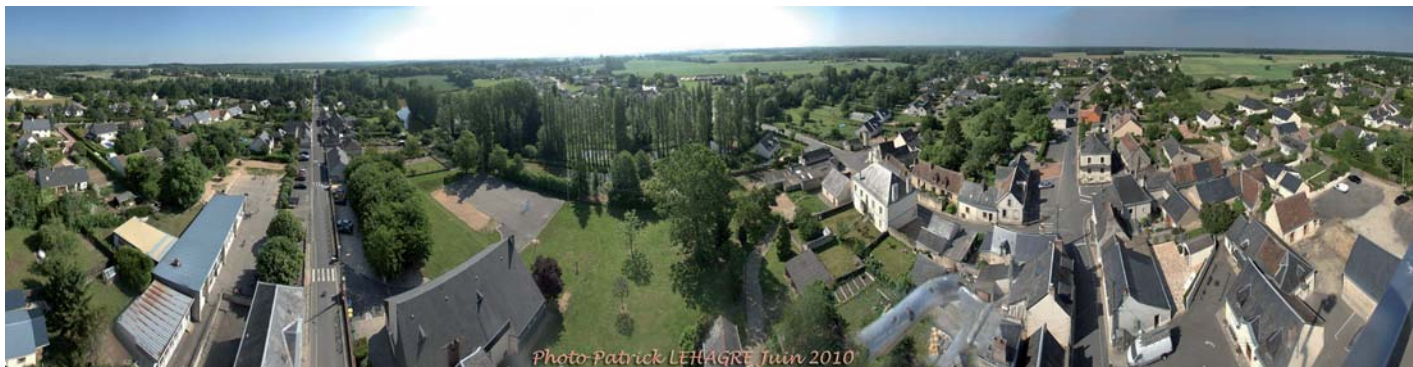
Juin 2010

La mise en conformité du paratonnerre a été réalisée le jeudi 3 juin. Ce fut l'occasion de faire quelques clichés panoramiques de notre village.