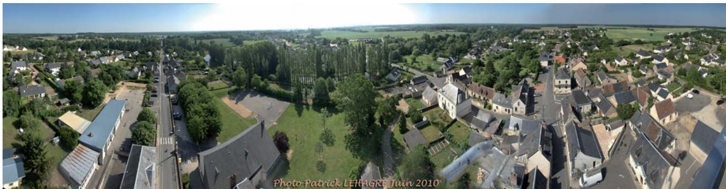
Juin 2010

La mise en conformité du paratonnerre a été réalisée le jeudi 3 juin. Ce fut l'occasion de faire quelques clichés panoramiques de notre village.