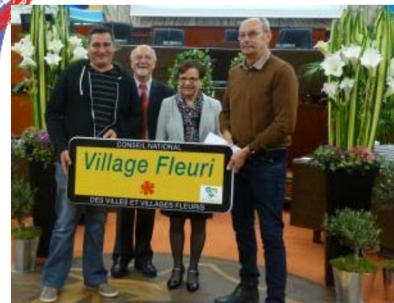
Une belle récompense!